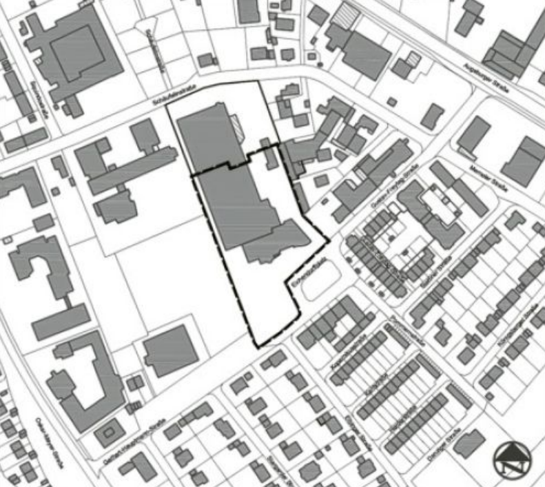
Vorhabenbezogener Bebauungsplan Nr. 91 "Gebiet südlich der Schäufelinstraße zwischen der Augsburgener Straße und der Oskar-Mayer-Straße" 7. Teiländerung (ehem. Strenesse-Gelände, 2. Bauabschnitt), Nördlingen

wirkungen im Sinne des Bundesimmissionsschutzgesetzes (BImSchG) verursacht werden und die Anforderungen an gesunde Wohnverhältnisse nach dem Baugesetzbuch (BauGB) erfüllt werden.